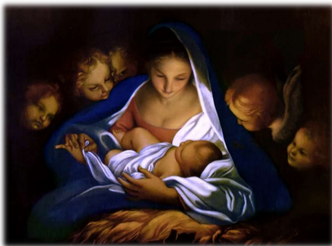
Carlo Maratta , 1650 Chiesa di San Giuseppe dei Falegnami, Roma

Le sei settimane che precedono il Natale sono caratterizzate dalla meditazione sulle cose ultime , quando il Risorto porterà a compimento la storia dell'umanità e dell'universo intero, e, in seconda battuta, sulla sua venuta storica tra noi nella carne. L'Avvento ci illustra, dunque, le due venute di Gesù : quella finale e quella nel nostro tempo. A noi il compito di accoglierLo assumendo l'atteggiamento di chi attende, seguendo l'invito tipico dell'Avvento: vegliate! Vegliare è opera spirituale che domanda energia per l'anima, forza che attingeremo dalla Parola e dall'Eucarestia.